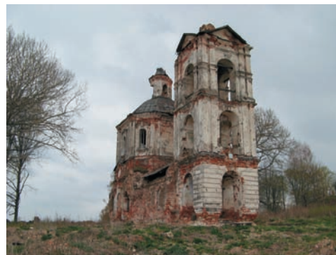
Качество изображения При небольшом участии пользователя можно добиться отличных результатов

Набор функций весьма широк для камеры подобного класса, особенно если учесть, что конкуренты не предлагают подобного изобилия в камерах-одноклассниках А710. На выбор пользователю предлагается 20 режимов съемки, среди которых есть полностью ручная, приоритет выдержки/диафрагмы и около десятка специальных сюжетных режимов,